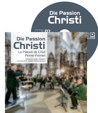
„Die Passion Christi“ Ferrer Ferran

Hiermit bestelle ich zum Preis von je nur 12 € pro Stück die CD „Markus-Passion“ von Jacob de Haan (zzgl. 4 € Versandkosten) _____ CD's (Anzahl)